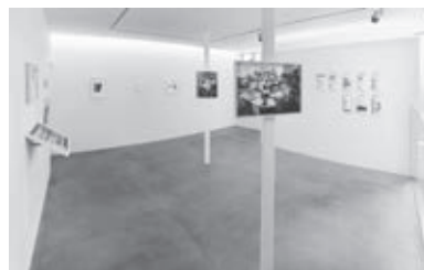
図4 《Gesture of Rally #1805》2018年 (「showcase #7 “写真とスキャン PHOTO & SCAN”」展(eN arts) 展示風景)