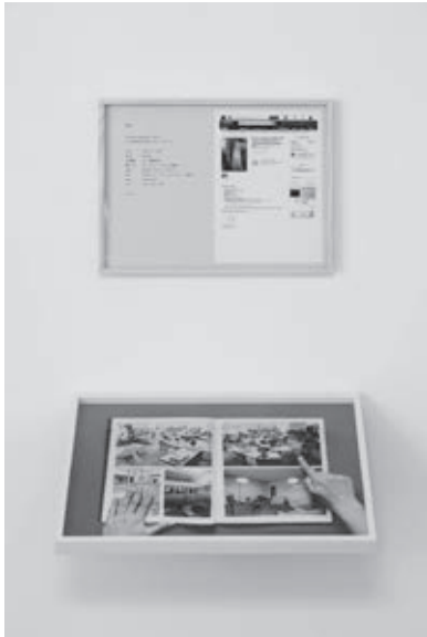
図6 《Gesture of Rally # 1805》(部分)