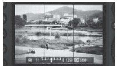
図2 《64のポストビューおよび目下のシーン》 2021年（部分）