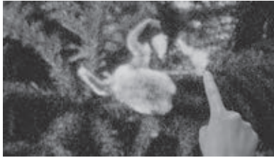
図5 《Gesture of Rally # 1805》(部分)