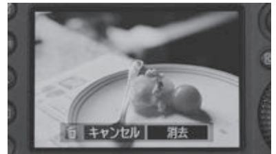
図1 《45のプレビューおよび目下のシーン》 2019年（部分）

以下では、シリーズごとに作品をとりあげながら考察を進めていく。最初に映像作品である《45のプレビューおよび目下のシーン》(2019年・図1)と《64のポストビューおよび目下のシーン》(2021年・図2)に注目し、つづいて初期の作品である〈Blow-up〉シリーズ(2016年-)と〈Gesture of Rally〉(2017年-)シリーズから各1作品をとりあげて考察する。