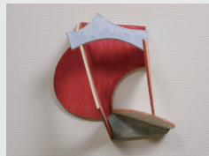
〈あかさかみつけ〉1981年 高松市美術館蔵