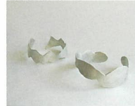
田中祐江 [鍍金小物] ※28・29日出店