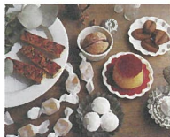
dolcemente(a)+OTTO [イタリアンデザートとお菓子] ※28・29日出店