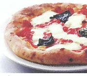
石窯PIZZA屋台boccheno [ピザ、かき氷] ※29・30日出店