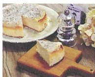
カフェ百時 [チーズケーキ]