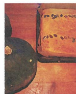
フレイトレンピ [オーガニック焼き菓子]