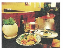
ごはん屋カカ [ごはん屋カカのお弁当]