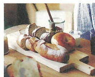
七穀ベーカリー [自家製酵母パン、豆乳ドーナツ] ※30日出店