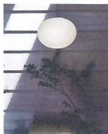
CALM DAYS [インテリア雑貨] ※28・29日出店