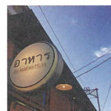
MINEMATSUYA [タイ、ベトナムのお弁当]