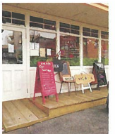
いとカフェ [お弁当、スパイス]