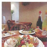
wine kitchen sabori [お弁当、ナチュラルワイン] ※29・30日出店