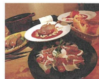
Minette [ピストロシネBOX・カンパニー]