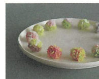
萬望工房&河野茶店 [季節の和菓子と日本茶] ※29・30日出店