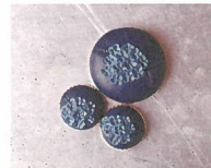
てのり イワタリエ [クレイアクセサリー] ※30日出店