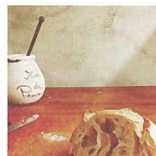
Pantricot [パン、焼き菓子] ※29・30日出店