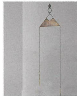
aei [アクセサリー、オブジェ]