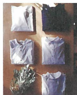
NEW WAY, NEW LIFE [洋服(メンズ・レディース)]

暮らしに関わるもの こだわりの中にもものづくりをしている 作家たちが集います。 つくりてとの会話を楽しみながら、 日々が豊かになるような作品や おいしいものにきっと出会えるはずです。