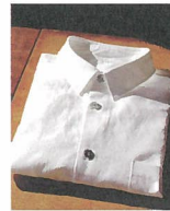
服屋 宮 [オーダーシャツ] ※29・30日出店