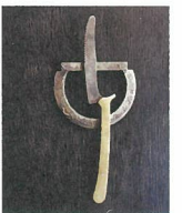
座辺身辺 [器、カトラリー]