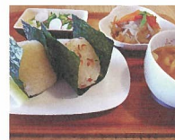
Cafe Musu.B [おにぎり]