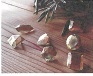
OpaLLios [彫金アクセサリー]