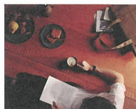
WELD SUPPLY CO. [家具、陶器、バッグ]