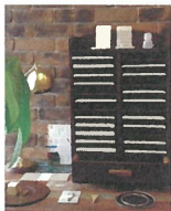
ヨシダインテリア [暮らしの雑貨]