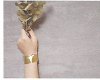
ウノダイサク [真鍮とシルバーの装飾品] ※30日出店