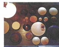
Taller de Maeda [木の器]