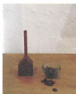
ヨシダコーヒータン [珈琲]