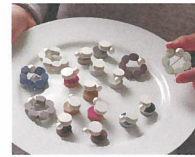
hitohira. [レザーアクセサリー]