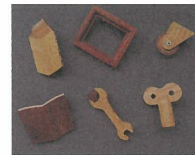
üki works [木製小物] ※28・29日出店