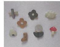
辻本路 [陶の箸置き、ブローチ]